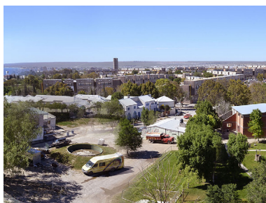
Foto aérea, predio Fundación Ceferino.