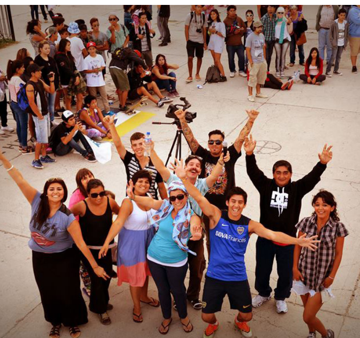
Escena final de la Radio Playa 2015. Otro clásico nuestro.