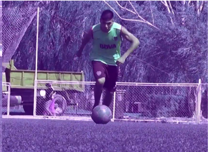
Golazo. Al mediodía, fútbol.