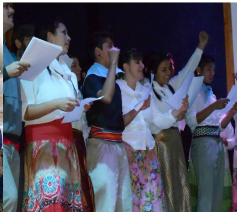
El Loncomeo de la fundación, de composición propia.