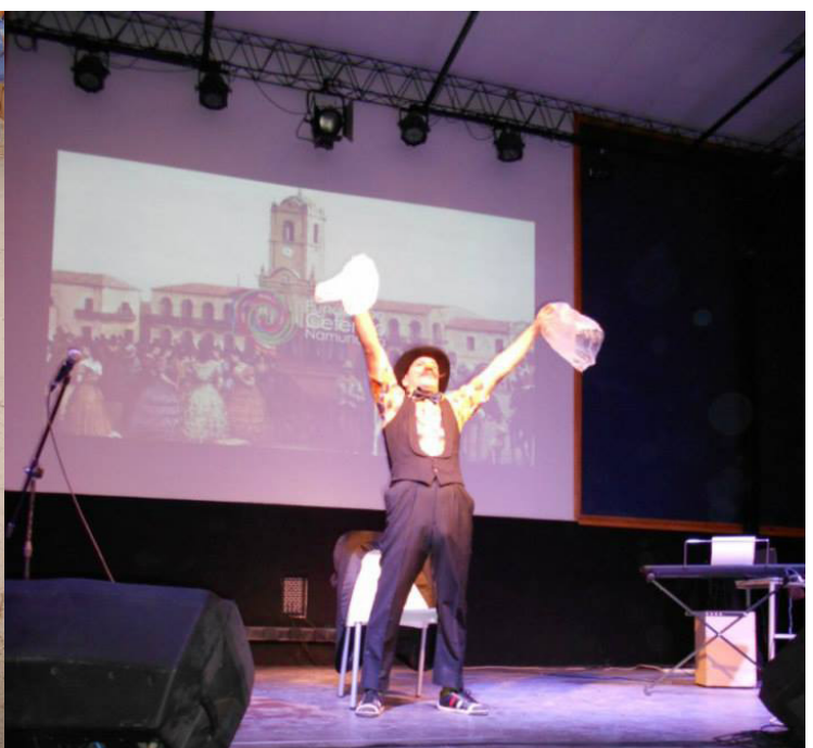
"Mostacho", numero de clown presente en las Efemerides.