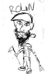
Las caricaturas de esta edición de Alto Boletín son de Emanuel Capello.