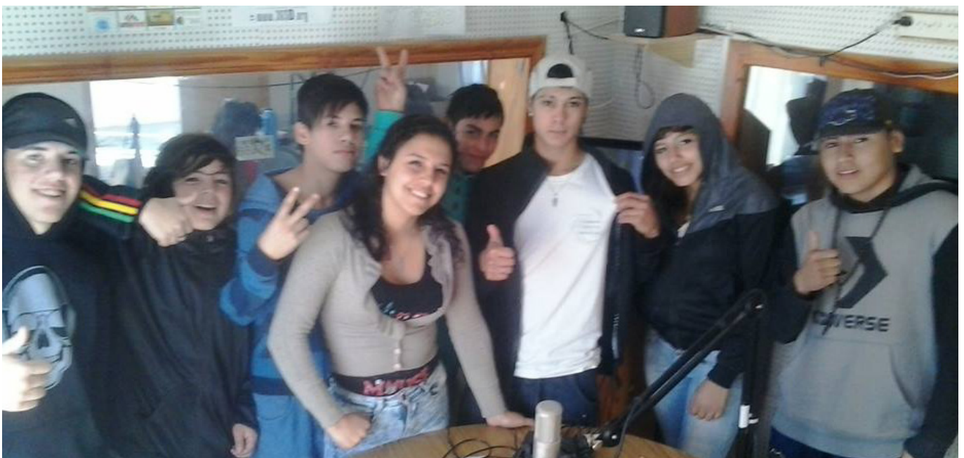
"La hora del chamuyo", programa del taller de Radio. Los domingos de 11 a 12.

Tras la jornada, se lanzó oficialmente en el país la red Enredados, de la que la emisora de la Fundación Ceferino forma parte. Tiene como objetivo garantizar el respeto de los derechos de los y las niñas y adolescentes de acuerdo a la Convención de los Derechos del Niño, que en Argentina tiene rango constitucional desde la reforma de 1994.