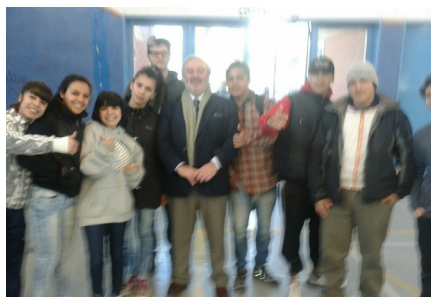
Los chicos con el Ministro Rubén Zárate.

Los chicos de segundo ciclo asistieron a la jornada “Mi primer voto”. Contó con la presencia del Ministro de Educación de la Provincia del Chubut, Rubén Zárate, quién se prestó para una foto con los pibes de la Fundación.