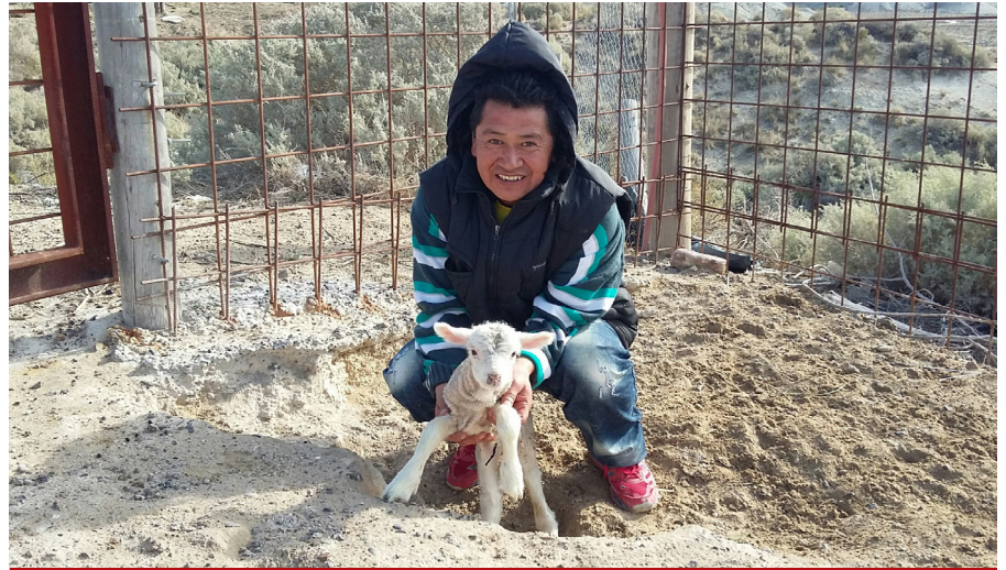
"El Abuelo" y el corderito recién nacido. Busca nombre.

Se trata de un carnero que ha servido para la reproducción de las últimas tres crías aquí en la Fundación: una de ellas nacida en mayo del año pasado y la otra, la inmediata anterior a ésta, en julio de 2015.